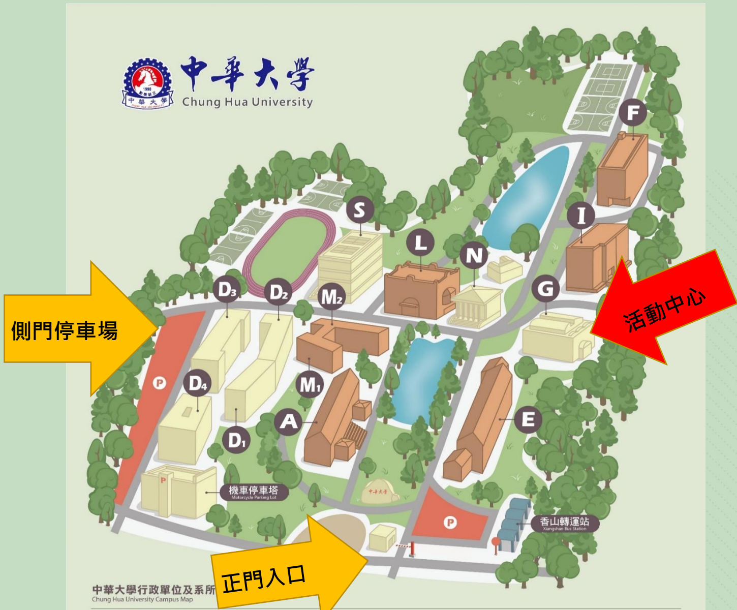
中華大學行政單位及系所 Chung Hua University Campus Map